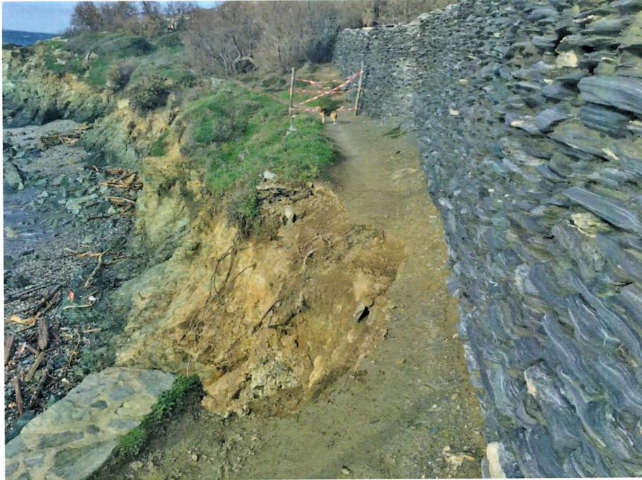
Photo 3 : effondrement du sentier des douaniers près de la fontaine

La continuité du tracé du sentier va donc prochainement être assurée et la qualité du site remarquable traversé sera maintenue.