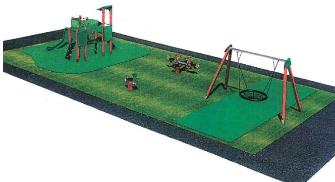
Illustration 1 : Future aire de jeux