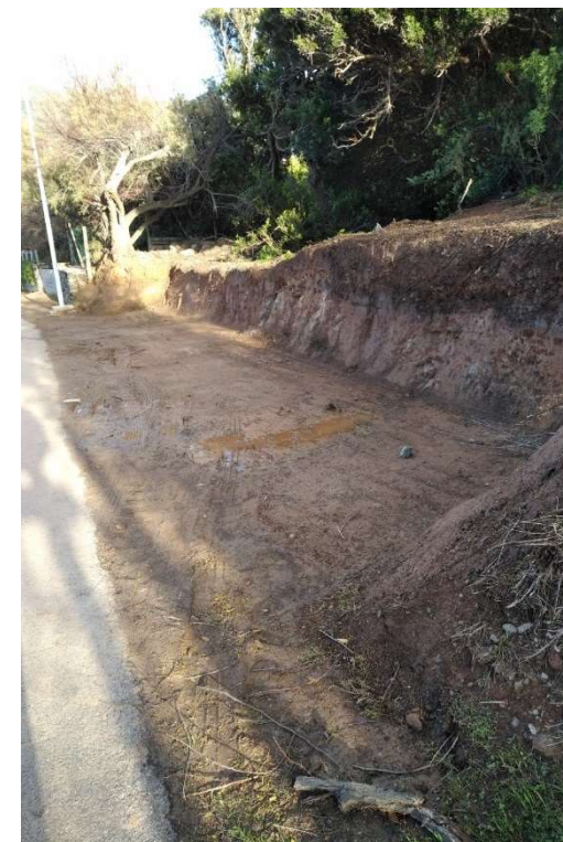
Photo 12 : Futur emplacement de la borne de rechargement pour véhicules électriques